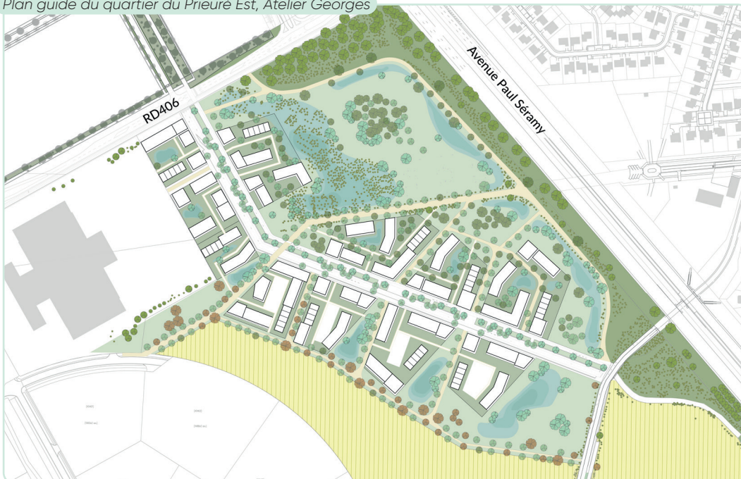
Plan guide du quartier du Prieuré Est, Atelier Georges

Desservi par un réseau de voiries en continuité avec les voies existantes entre la RD 406 et la rue du Poncelet