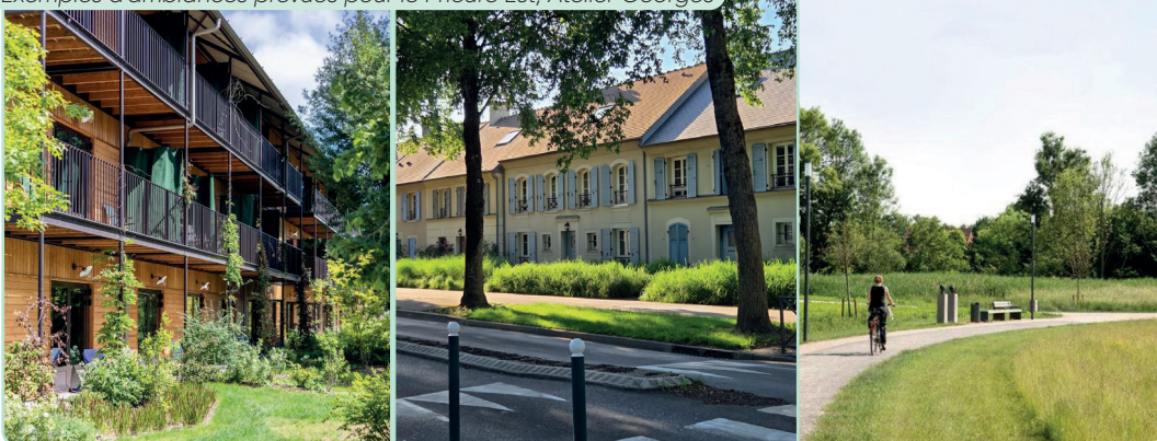
Exemples d'ambiances prévues pour le Prieuré Est, Atelier Georges