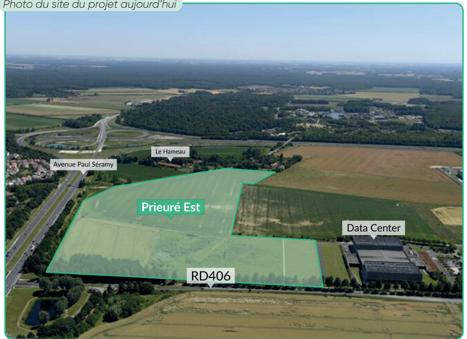
Photo du site du projet aujourd'hui