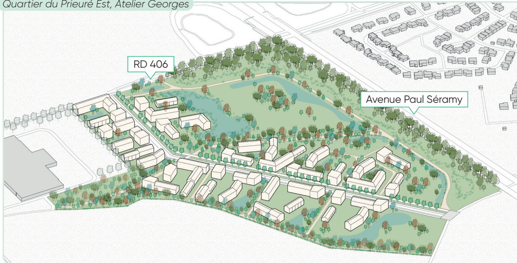
Quartier du Prieuré Est, Atelier Georges

Le projet repose également sur des principes bioclimatiques et bas carbone.