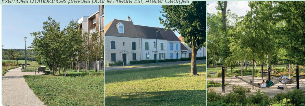
Exemples d'ambiances prévues pour le Prieuré Est, Atelier Georges