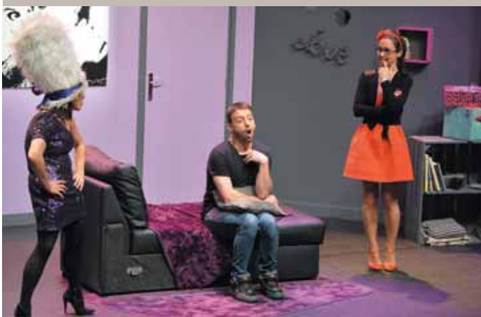
Bonjour Ivresse ! (20/05) : éclats de rire assurés