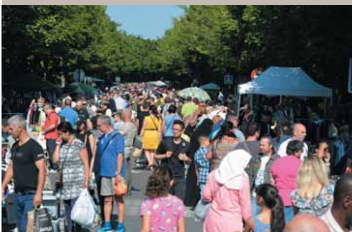
Brocante et fête de l'été (18/06) : un dimanche de détente