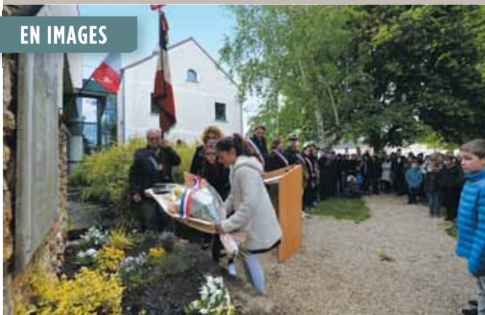
Cérémonie du 8 mai (8/05) : devoir de mémoire